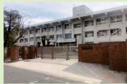
五日市東小学校 約500m(徒歩7分)