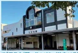
JR「五日市」駅 約1,100m(徒歩14分)

JR・広電電車・バスの3つの公共交通機関に加え、車なら西広島バイパス入口にも近く、広島市中心部へも郊外へも、どこに行くにも便利な好立地です。