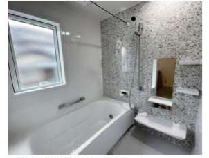
清潔で快適な最新のバスルーム。