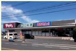
ウォンツ皆賀店 約420m(徒歩6分)

近くには、コンビニ・スーパー・ドラッグストア・病院など、日常の生活に欠かせない施設が揃っています。