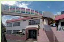
ひろみ幼稚園 約470m(徒歩6分)

保育園や幼稚園、小学校が歩いてすぐの場所にあり、公園も近いので、小さなお子さまを持つ若いご家族にも安心でうれしい街です。