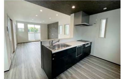
人気の対面キッチンを採用。

3階建て分譲住宅(B棟)4,380万円(税込)をご購入の場合のお支払い例 頭金0円 月々返済 66,845円 ボーナス払い 99,509円(年2回) ■借入金／4,380万円(毎月3,510万円、ボーナス870万円) ※提携銀行ローン、変動金利0.545%、50年返済の場合のお支払い例。 ※この他にも諸費用が別途必要です。詳しくは保真員にお問い合わせください。