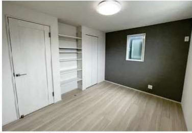
便利に使える1階の納戸。