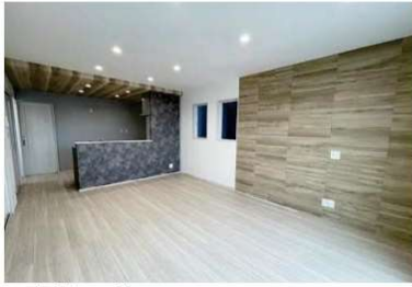
シックな装いの2階のLDK。

優れた調湿機能や有害物質を軽減する健康的な内装材「エコカラット」の採用など、こだわりのインテリアで上質な暮らしを実現する3階建て住宅が新登場。