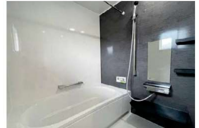
1日の疲れを癒す最新のバスルーム。

「佐伯区皆賀」都心にも近く、便利で閑静な住環境。高い人気を誇る注目のエリアです。