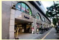
五日市福屋 約930m(徒歩12分)